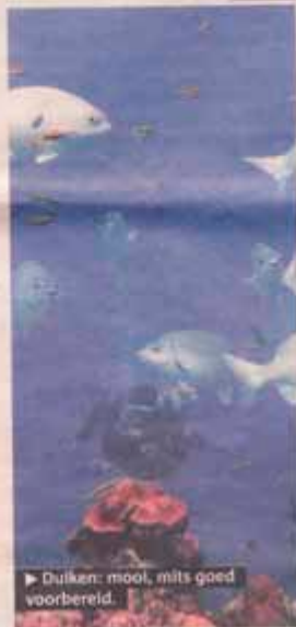
► Duiken: mooi, mits goed voorbereid.